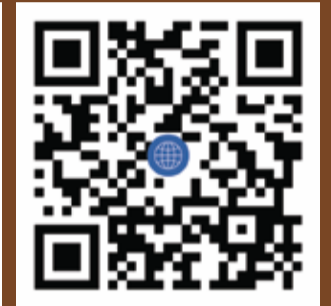
สนใจสมัคร Admission www.admission.hu.ac.th