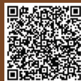
Website ทุนการศึกษา

** ข้อ 1-8 ตรวจสอบและส่งเอกสารผ่าน Line Menu