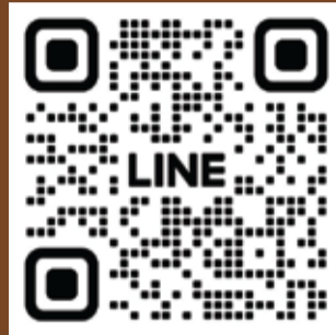
Line OA @hatyaiu