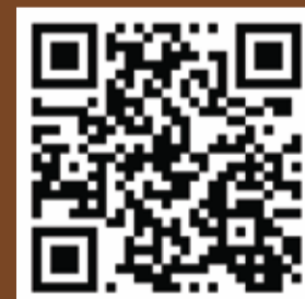
Website สิ่งอำนวยความสะดวก