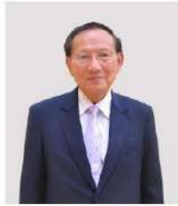
ศาสตราจารย์กิตติคุณ ดร.สุจิต บุญบงการ นายกสภา