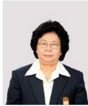
อาจารย์ประวีต อึ้งยศจิน ท่านผู้อาวุโส และอุปนายกสภามหาวิทยาลัยเทคโนโลยีพระจอมเกล้าธนบุรี