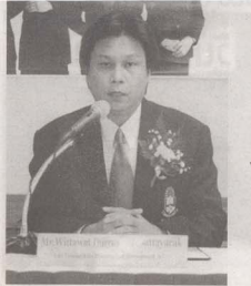
ศาสตราจารย์ ประสริต อูเออรสิว