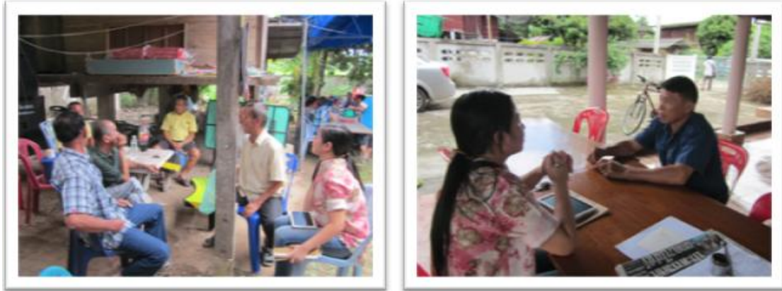
ภาพที่ 4 การมีส่วนร่วมของภาคประชาชนเพื่อร่วมกันวางแผนการจัดการแหล่งโบราณคดี