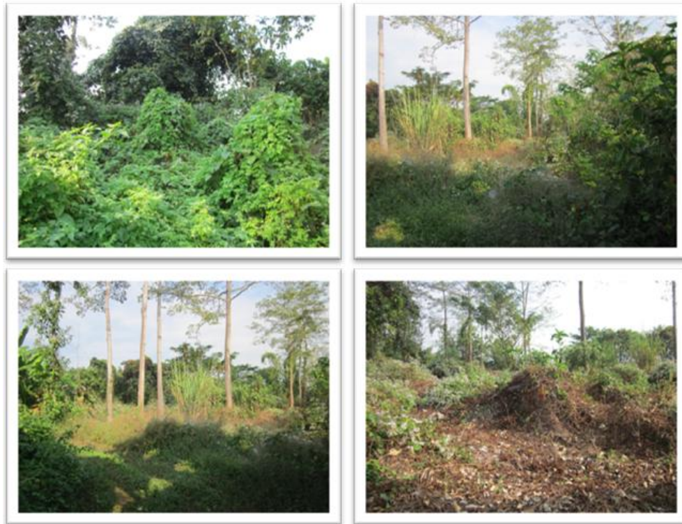
ภาพที่ 1 บริเวณพื้นที่ที่ถูกปกคลุมด้วยหญ้ารกและปิดบังโบราณสถานไว้