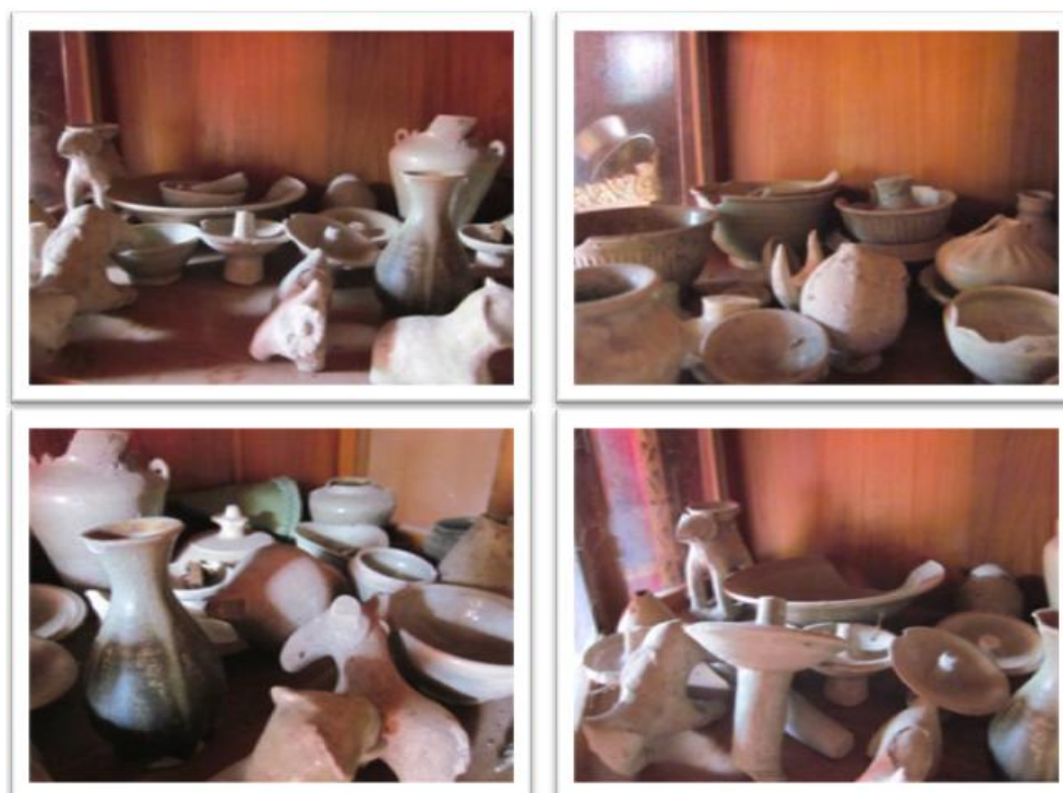
ภาพที่ 3 ผลึกภัณฑ์ที่ชาวชุมชนเคยเก็บจากพื้นที่ ปัจจุบันเก็บรักษาไว้ที่วัด โป่งแดง เนื่องจากตำนานและความศักดิ์สิทธิ์ของพื้นที่