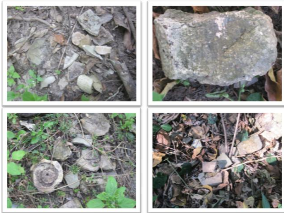
ภาพที่ 2 ผลึกภัณฑ์ที่พบในพื้นที่ ถูกปกคลุมด้วยหญ้ารกและปดบังไว้