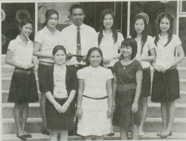
ทีมชนะเลิศ

มูลนิธิยุทธสาร ณ นคร เพื่อสมาคมการจัดการธุรกิจแห่งประเทศไทย (TMA) ปีนี้ จัดในหัวข้อ TMA CSR Project คือให้นักศึกษาจัดทำโครงการที่มีแนวคิดรับผิดชอบต่อสังคม โดยมีนักศึกษาจากทั่วประเทศส่งโครงการเข้าประกวด 23 โครงการจาก 25 สถาบัน ปรากฏว่าทีมที่ได้รับรางวัล